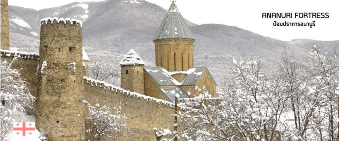
ANANURI FORTRESS ป้อมปราการอนานูรี

นำท่านชม ป้อมอนานูรี (ANANURI FORTRESS) ป้อมปราการเก่าแก่ ที่มีกำแพงล้อมรอบ ตั้งอยู่ริมแม่น้ำอาร์กี สร้างขึ้นในสมัยศตวรรษที่16-17 ภายในยังมีโบสถ์ 2 หลังสร้างอย่างงดงามและยังมีหอคอยทรงสี่เหลี่ยมสูงใหญ่ตั้งตระหง่านอยู่ ทำให้เห็นทัศนียภาพทิวทัศน์อันสวยงามด้านล่างจากมุมสูงของป้อมปราการนี้ (ใช้เวลาเดินทางประมาณ 1.10 ชั่วโมง)