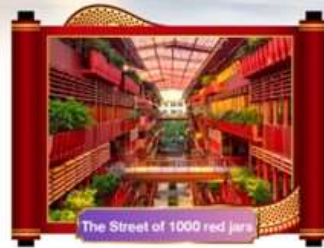
The Street of 1000 red jars

เดินทางโดยสายการบิน ไซน่าอีสเทิร์นแอร์ไลน์