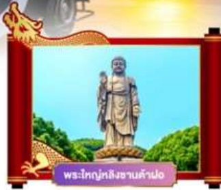
พระใหญ่หลังซานต้าฝอ